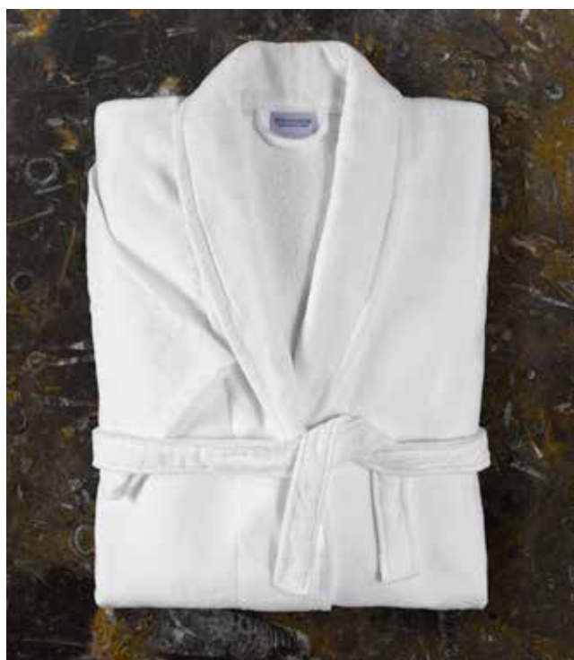
BADJAS • PEIGNOIR • BATHROBE: DOLCEZZA

Other bathrobe colours, sizes or embroideries are possible, imposing a minimum production quantity of 300 bathrobes and lead times.