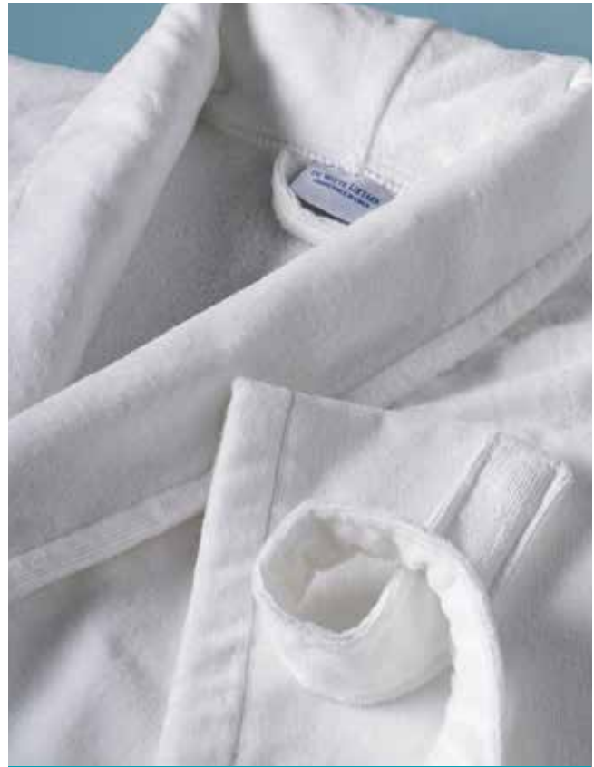
BADJAS • PEIGNOIR • BATHROBE: DOLCEZZA